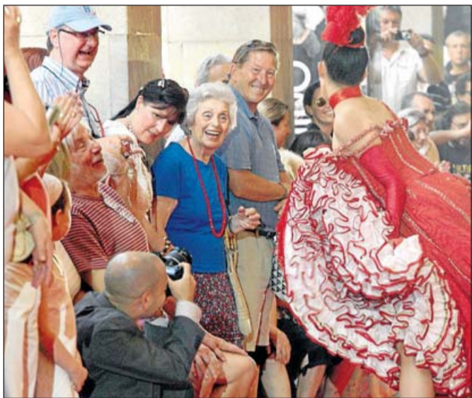
Las artistas derrocharon sensualidad.