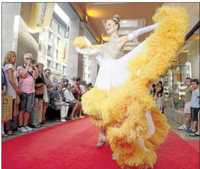
Plumas de boa, colorido, aires de fiesta.