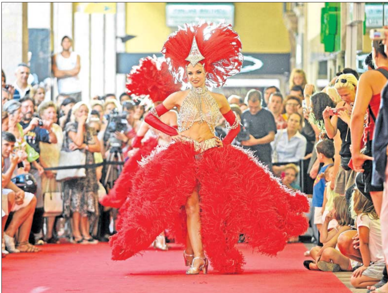
El público abarrotó la calle para vibrar con la belleza de las bailarinas francesas.