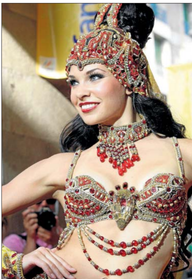
Tocados sugerentes, pedrería de lujo.